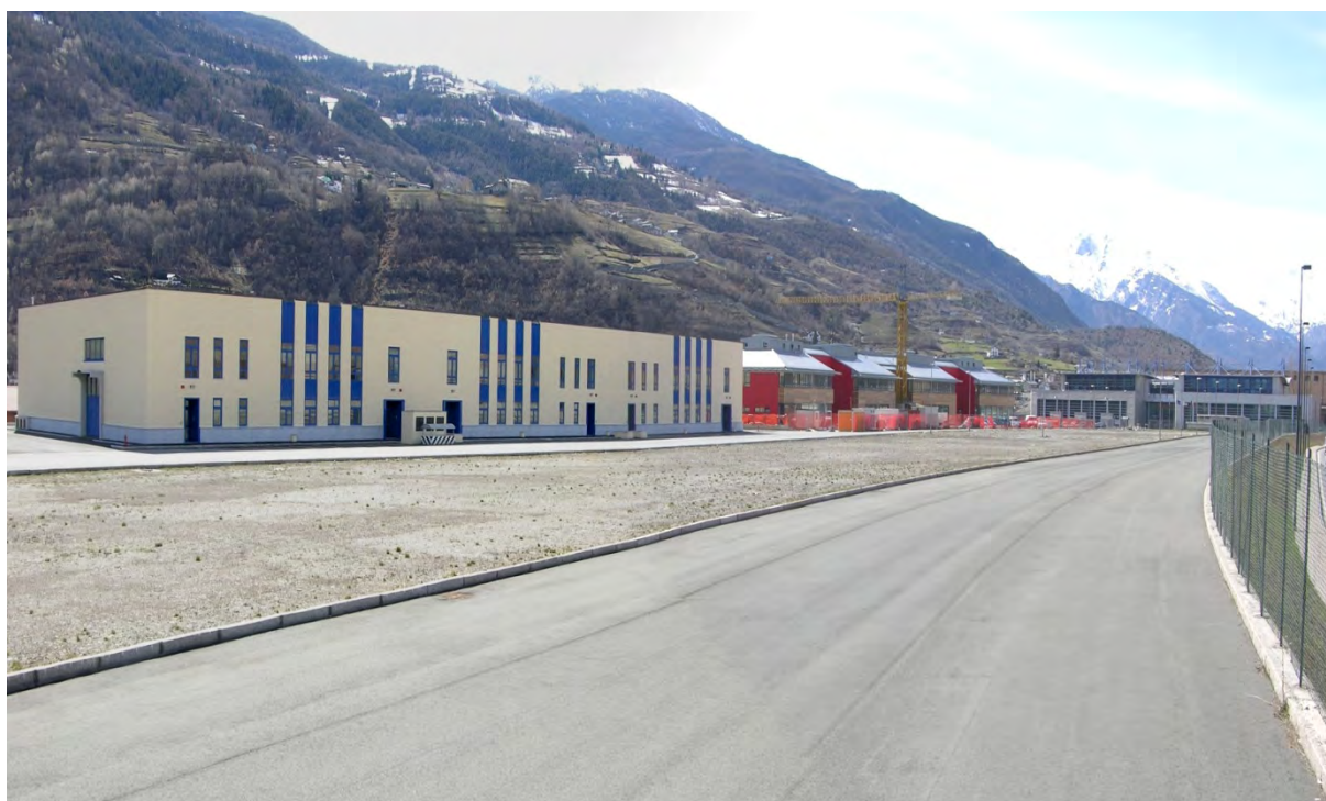
Edificio E - Area Espace Aosta

Si segnala che, oltre alla riserva legale, non esistono altre riserve non distribuibili per effetto di deroghe o capitalizzazioni effettuate ai sensi degli articoli 2423 e 2426 Codice Civile, eccezion fatta per i costi di impianto e ampliamento ancora da ammortizzare al termine dell'esercizio, oneri sostenuti in relazione all'aumento del capitale sociale, per circa 3 mila Euro. Tale fattispecie genera un vincolo di indisponibilità per pari importo sulle riserve di utili.